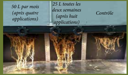
Oak Hill Country Club Parcours West Course