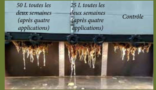
Oak Hill Country Club Vert d'exercice