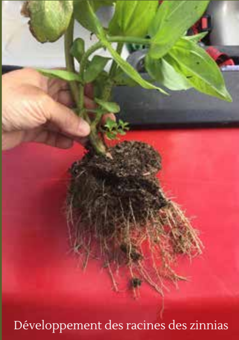
Développement des racines des zinnias

Pendant dix années d'essais et de recherches universitaires, Worm Power Turf a démontré de façon constante qu'il améliore la force, la vigueur et la santé des plantes